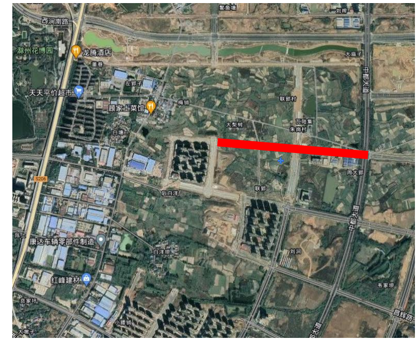
注：绿化景观以园林部门审定方案为准